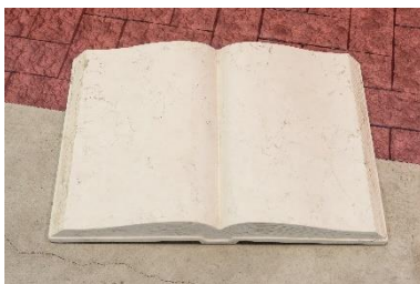
Catherine Biocca (*1984 Rom) Volatile Compounds , 2019 Audio-Video Installation Metallgestell, PVC-Druck, Projektion, Marmorbuch, falsche Ziegelsteine, Lautsprecher 500 x 600 x 200 cm