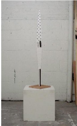
Zin Taylor (*1978 Calgary) Double Sliver / Stripes and Dots (2nd turn) , 2014 Gipsstoff, Holz, Epoxid-Ton, Farbe 133 x 45 x 45 cm Courtesy der Künstler und Susan Hobbs Gallery, Toronto, Kanada