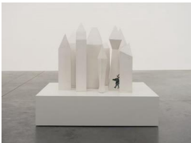
Grace Schwindt (*1979 Offenbach) Home , 2018 Glasierte Keramik, 10-teilig 60.5 x 100 x 90 cm Courtesy Zeno X Gallery, Antwerpen