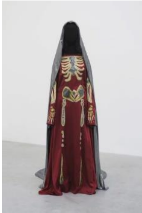
Grace Schwindt (*1979 Offenbach) Skeleton Dress , 2016 Seide, Metallgewebe, Metallfaden, Modell 173 x 90 x 135 cm Courtesy Zeno X Gallery, Antwerpen