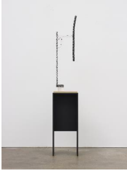
Zin Taylor (*1978 Calgary) A Tool for Stripes and Dots (the elephant / the elements of the base collect into an appendage) , 2014 Gips, Farbe, Holz 100 x 27 x 10 cm