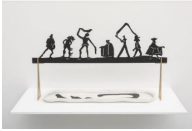
Grace Schwindt (*1979 Offenbach) This Magic , 2017 Holz, Kohle und Porzellan 34 x 59.1 x 11.1 cm