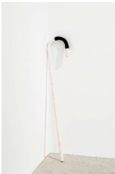
Zin Taylor (*1978 Calgary) Cane (Black Curve) , 2017 Gips, Acrylfarbe, PVC 89 x 16 cm Courtesy der Künstler und Susan Hobbs Gallery, Toronto, Kanada