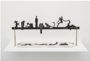
Grace Schwindt (*1979 Offenbach) Last Round of Magic , 2017 Holz, Kohle und Porzellan 29.3 x 64.7 x 11 cm