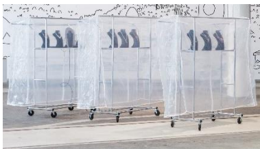
Catherine Biocca (*1984 Rom) SABOTAGE , 2019 Audio-Video Installation Metallständer, Schmuck-Display, Schmuck, Bildschirm, Kopfhörer Ortsspezifische Dimension Courtesy die Künstlerin und PSM, Berlin