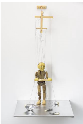
Grace Schwindt (*1979 Offenbach) In Five Parts , 2017 Treibholz, Birke, Leder, Polymer-Ton, Schnur, Aluminium, Stahl und Wachs 90 x 50 x 44 cm