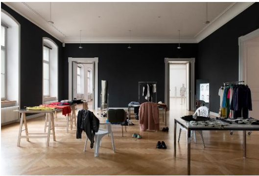
turning inside out , 2019 Installation, verschiedene Materialien; 2 Garderobenspiegel, 2 Kleiderständer, 3 Tische, 4 Stühle, diverse Kleider, Schuhe, verschiedene Accessoires Raummasse: 4.40 x 8.62 x 10.28 cm