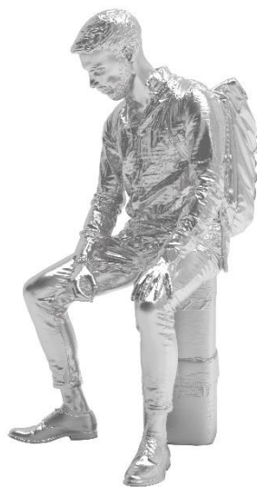
o.T. [Christoph], 2019 Aluminiumguss Kunstgiesserei St.Gallen 76.8 x 91.5 x 149 cm