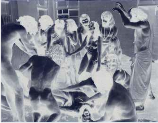
1979 [ First Step Toward Achieving Superconsciousness ], 2016 Leuchtkasten, Aluminium eloxiert, LED 180 x 235 x 10 cm Courtesy, Galerie Skopia Genève Hengesbach Gallery Wuppertal