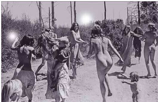
1971 [ into the light ], 2019 Leuchtkasten, Aluminium eloxiert, LED 200 x 315 cm x 10 cm