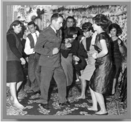
1974 [Teheran 2] , 2019 Leuchtkasten, weiss lackiert, LED 94 x 100 x 10 cm Courtesy, Galerie Skopia Genève Hengesbach Gallery Wuppertal