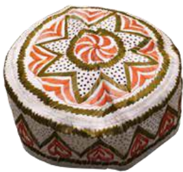
Kinderhut , 2015 7 x 20 x 20 cm