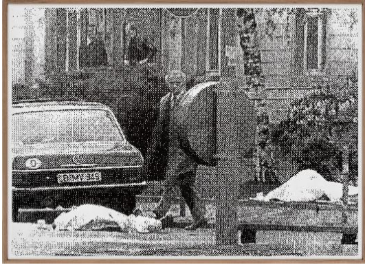
07-04-1977-0915 [ Buback 4 ], 2011 Tusche auf Papier 200 x 280 cm