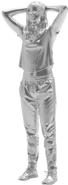
o.T. [Ana], 2019 Aluminiumguss Kunstgiesserei St.Gallen 67.6 x 47.1 x 186 cm