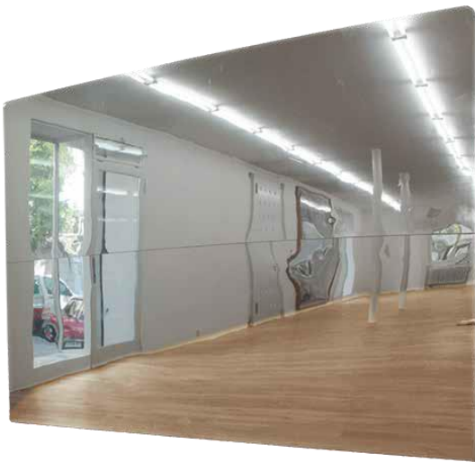
Spiegelwand , beidseitig verspiegelt 3 Spiegel, je 120 x 250 cm Tragekonstruktion, 360 x 250 x 50 cm