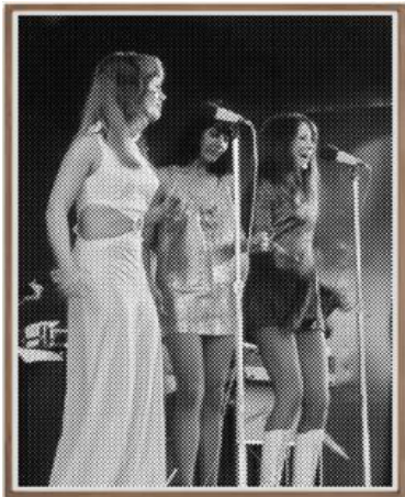
1971 [ Entertainers at the Aussie Badcoe Club Vung Tau, Vietnam ], 2018 Tusche auf Papier 230 x 187 cm