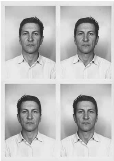
Same but Different , 2018 Leuchtkasten, Aluminium weiss eloxiert, LED 73 x 133 cm x 10 cm