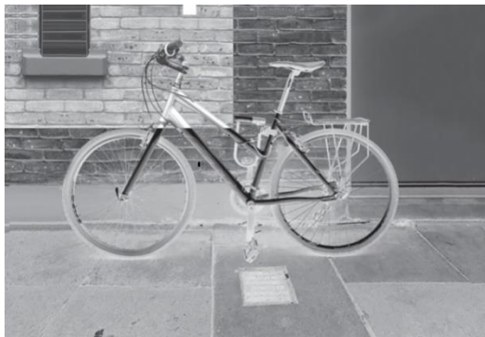
Re_construction [bike] , 2015-2019 Abfolge von 400 Fotos auf 4 Flachbildschirmen Loop, 27' Courtesy, Galerie Skopia Genève Hengesbach Gallery Wuppertal