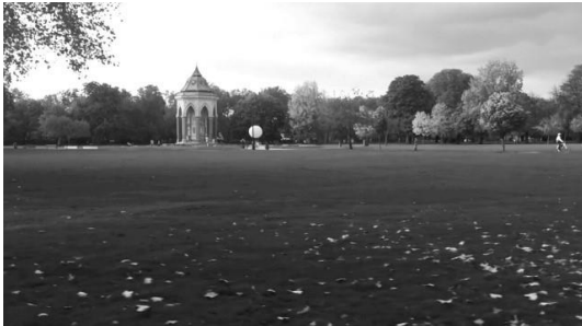
Catch the day , 2015 – 2019 Video, Loop, Ton, 04'46'' Courtesy, Galerie Skopia Genève Hengesbach Gallery Wuppertal