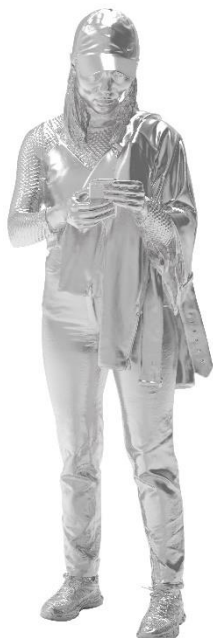
o.T. [Romy], 2019 Aluminiumguss Kunstgiesserei St.Gallen 63.6 x 68.4 x 185 cm