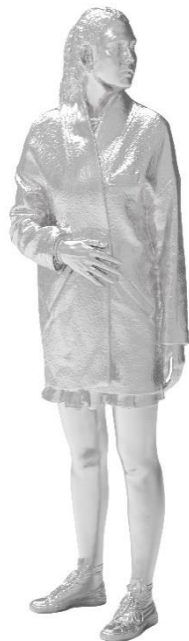
o.T. [Shirin], 2019 Aluminiumguss Kunstgiesserei St.Gallen 62.4 x 46.5 x 186 cm