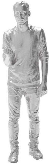
o.T. [Reinhard, right], 2019 Aluminiumguss Kunstgiesserei St.Gallen 70.4 x 44.9 x 186 cm