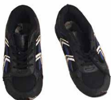
1 Paar Kinderschuhe , 2015 7 x 20 x 5 cm