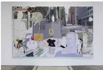
MPGA (6) , 2021 Öl und UV-Druck auf Fotopapier auf Leinwand aufgezogen 247,65 × 398,78 cm Foto: Stefan Rohner

© Michael Williams. Courtesy der Künstler, Galerie Eva Presenhuber, Zürich und New York, Gladstone Gallery, New York und Brüssel, und David Kordansky Gallery, Los Angeles