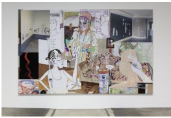
MPGA (5) , 2021 Öl und UV-Druck auf Fotopapier auf Leinwand aufgezogen 247,65 × 398,78 cm Foto: Stefan Rohner

© Michael Williams. Courtesy der Künstler, Galerie Eva Presenhuber, Zürich und New York, Gladstone Gallery, New York und Brüssel, und David Kordansky Gallery, Los Angeles