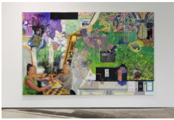
MPGA (3) , 2020 Öl und UV-Druck auf Fotopapier auf Leinwand aufgezogen 247,65 × 398,78 cm Foto: Stefan Rohner

© Michael Williams. Courtesy der Künstler, Galerie Eva Presenhuber, Zürich und New York, Gladstone Gallery, New York und Brüssel, und David Kordansky Gallery, Los Angeles