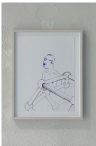
Atomic Man , 2020 Tintenstift und Kugelschreiber auf Papier 30,2 × 22,8 cm