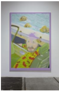
Mauve Dog , 2020 Tintenstrahldruck auf Leinwand 297 × 214 cm Foto: Stefan Rohner

© Michael Williams. Courtesy der Künstler und Galerie Eva Presenhuber, Zürich und New York