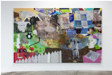
MPGA (4) , 2020 Öl und UV-Druck auf Fotopapier auf Leinwand aufgezogen 247,65 × 398,78 cm

© Michael Williams. Courtesy der Künstler und Galerie Eva Presenhuber, Zürich und New York